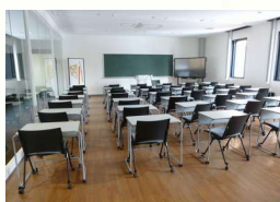
プレゼンテーションルーム