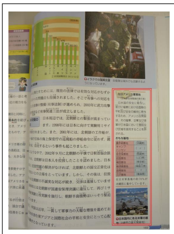
▲ 育鵬社の公民教科書と沖縄基地問題についての記述箇所（右）